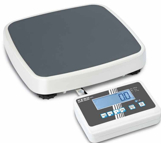
KERN MPC 250K100M

Pèse-personne compact avec approbation médicale pour une utilisation professionnelle dans le diagnostic médical, homologation en option