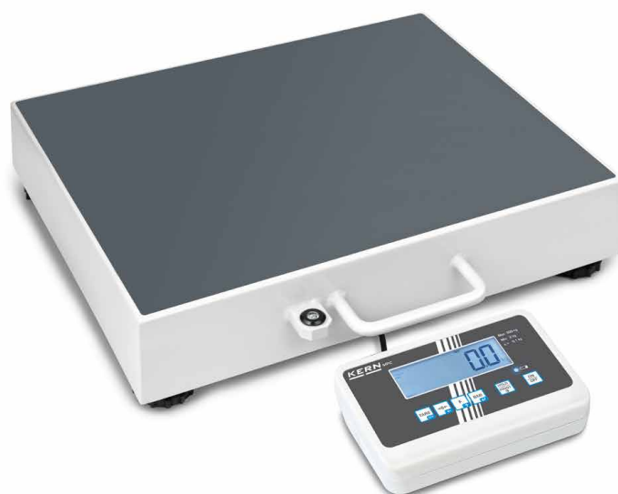
KERN MPC 300K-1LM